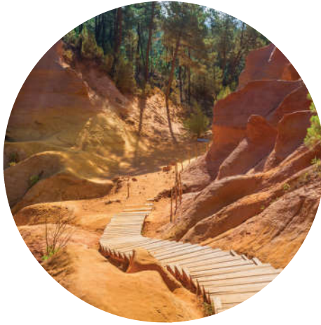
VOTRE PROGRAMME SUR MESURE