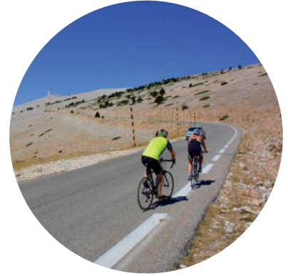
VOTRE PROGRAMME SPORTIF