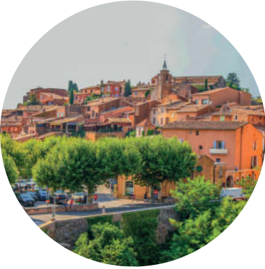
VOTRE PROGRAMME TOURISTIQUE